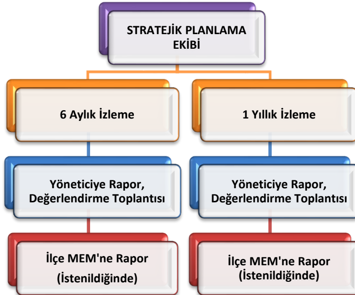
Şekil 3 Stratejik Plan İzleme ve Değerlendirme Modeli

Müdürlüğümüzün 2024-2028 Stratejik Planı İzleme ve Değerlendirme sürecini ifade eden İzleme ve Değerlendirme Modeli hazırlanmıştır. Okulumuzun Stratejik Plan İzleme-Değerlendirme çalışmaları eğitim-öğretim yılı çalışma takvimi de dikkate alınarak 6 aylık ve 1 yıllık sürelerde gerçekleştirilecektir. 6 aylık sürelerde Okul Müdürüne rapor hazırlanacak ve değerlendirme toplantısı düzenlenecektir. İzleme-değerlendirme raporu, istenildiğinde İlçe Milli Eğitim Müdürlüğüne gönderilecektir.